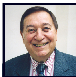
2015: MARCELLO ABBADO (ITALIA)